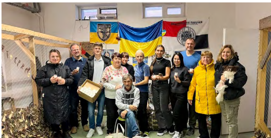
Centrum Spletinia Prešov

Veľmi milými sú aj maľované obrázky od detí pre obrancov na fronte, od miestneho kaplána máme informáciu, že ich to vždy poteší a pripomenie, že okrem tých zákopov, kde trávajú mesiace, niekedy aj viac, existuje ešte stále aj normálny svet, pre ktorého obranu sa oplatí vydržať. Deti by mali vedieť, pre koho sú určené, pokojne tam môžu napísať aj milý odkaz - ne-