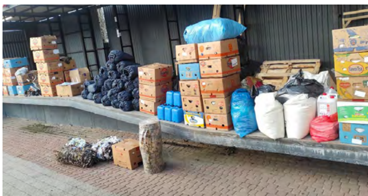
Užhorod 27 12 2024